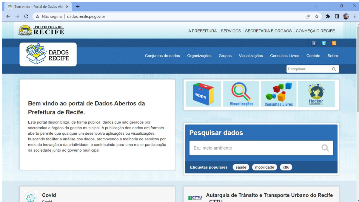
Figura 1 - Cópia da tela inicial do Portal de Dado Abertos da Prefeitura do Recife

Os dados disponibilizados no Portal de Dados Abertos do Recife (Figura 1) seguem os seguintes princípios e diretrizes: